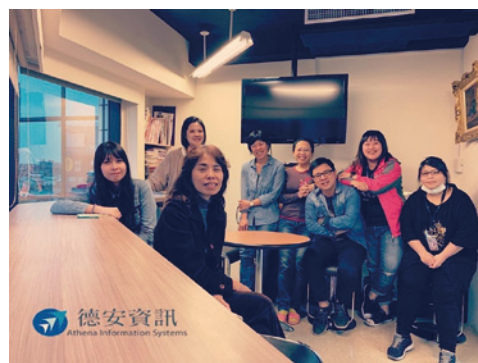
◀ 怡伶改變之後，不只洗刷自己污名，更得到經理與協理的肯定。

感謝主！這真是不容易！經理也說這次年度考核會一併提報加薪。當我填寫自己去年度KPI時數時，相當驚訝，沒被調職前上線專案是九個，調客服組卻結了二十一個，當初因為被調組，難過得不得了，沒想到神的作為如此奇妙！